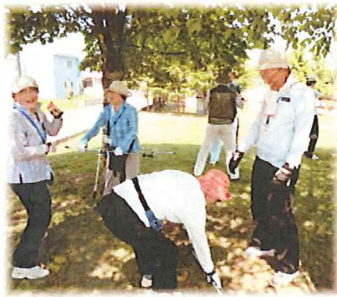
ボールを使っのゲーム♪6月上旬は暑さが厳しかったので木陰を利用して行いました