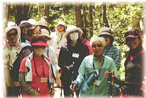
緑の美しい季節になってきました♪