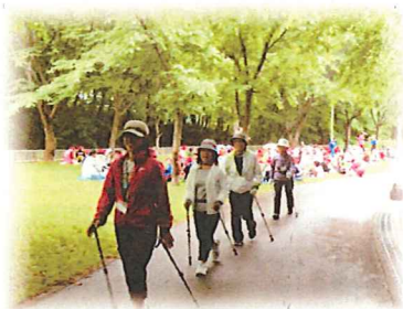
日差しが強くなってきました。 サングラスを用意する方が増えてきたのは良いことです(*_*)