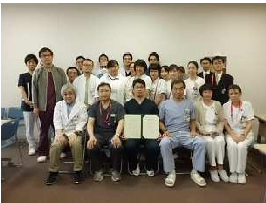
当院の職員と記念撮影