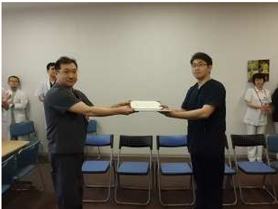
2週間の研修を終えての修了証書授与