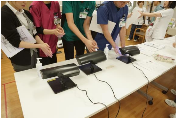
爪や指の股等は汚れが残りやすい部分です