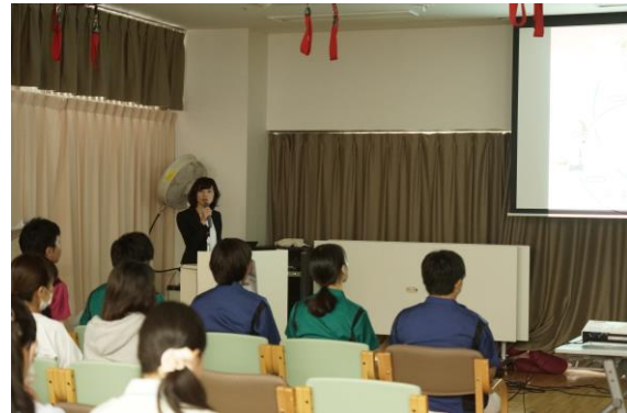
実践！ ブラックライトで汚れを確認